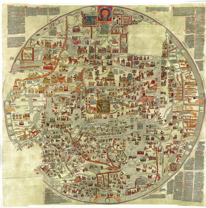
Илл. 1: Эбсторфская карта. XIII в.

ческое тело Христа (1Кор. 12:12 — 27; Еф. 5:23 — 30) или совокупность Божества и тварного мира, — это можно видеть на немецкой Эбсторфской карте мира конца XIII в. (Илл. 1).