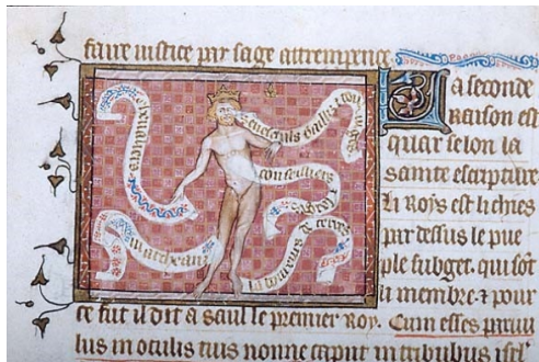
Илл. 5: Политическое тело. Совет королям. Библиотека Моргана, Нью-Йорк. XIV в.

В рукописи «Совета королям» середины XIV в. (Pierpont Morgan Library, MS M. 456, fol. 5r., Илл. 5) присутствует визуализация этой метафоры — одна из немногих, поскольку политическое тело нечасто получает визуальное воплощение в XIV — XV вв. На миниатюре изображено обнажённое, пропорциональное тело, с явными мужскими вторичными половыми признаками (например, с бородой), голову которого венчает корона, а другие части тела соотносены с социальными группами посредством подписей 55 .