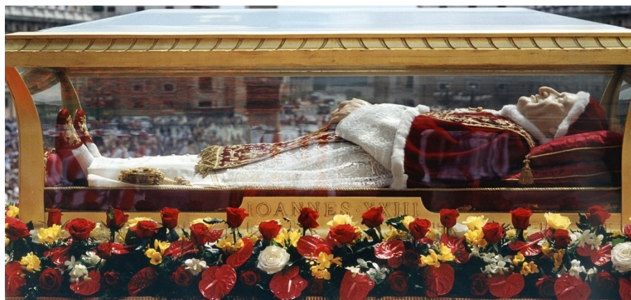
Рис. 9. Выставление напоказ тела усопшего Иоанна XXIII на площади Святого Петра при его перемещении в день Пятидесятницы, 3 июня 2001 года.