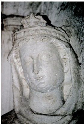
Рис. 2. Изабелла Арагонская. Надгробная статуя. Козенца, кафедральный собор (деталь), до 1276 г. Явно виден отек на правой (с точки зрения зрителя) стороне.