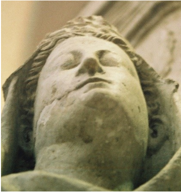
Рис. 4. Изабелла Арагонская (см. рис. 2). Видны смещённая вправо от центральной оси нижняя челюсть и опухшая половина лица.