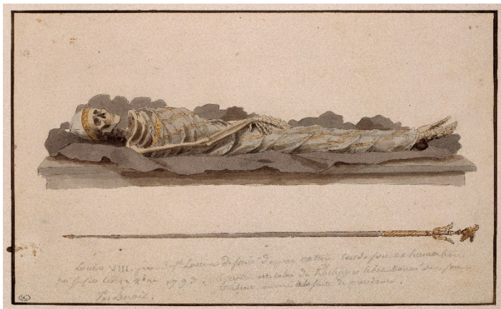
Рис. 1. Состояние останков Людовика VIII при эксгумации. Рисунок Александра Лемуара, 1793 г.