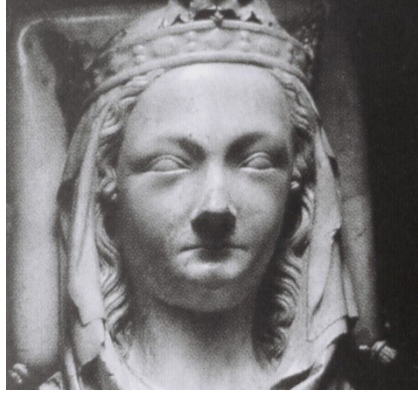
Рис. 5. Надгробная скульптура. Сен-Дени, кафедральный собор (деталь) ок. 1275 г.