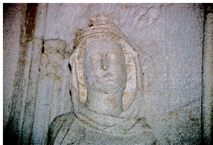
Рис. 3. Изабелла Арагонская (см. рис. 2). Видны длинный острый нос, приподнятый уголок рта и заостренный подбородок.