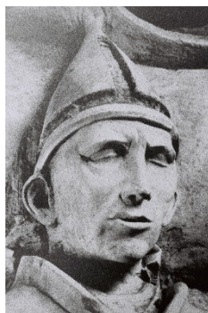
Рис. 8. Надгробная Надгробная скульптура Климента IV., Витербо, Сан-Франческо, не позднее 1271 г.