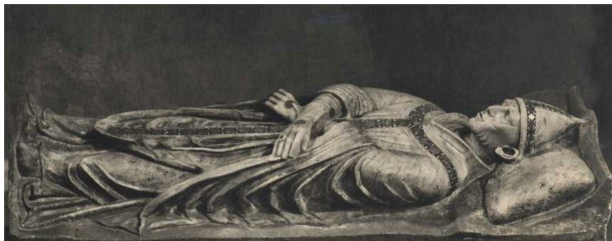
Рис. 7. Надгробная фигура Климента IV. Витербо, базилика Сан-Франческо (деталь).