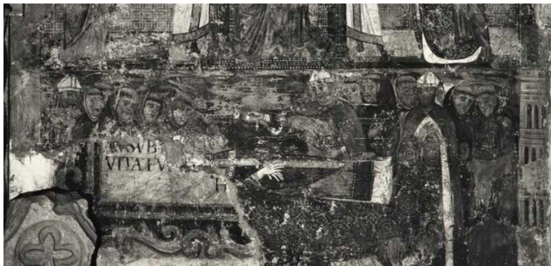
Рис. 10. Фреска изображающая погребение видного священнослужителя. Витербо, базилика Сан-Франческо (деталь).