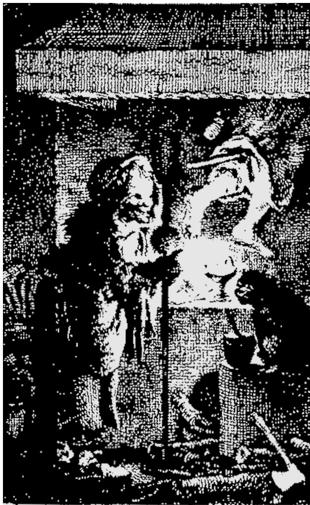
Ил. 10. “Ведьма, готовящая зелье и ведьма, улетающая на шабаш 64 ”. Гравюра из памфлета: “A full Confutation of Witchcraft”, 1712

ской графике, как и в литературе, эти темы, напротив, популярными не стали. Первые изображения такого рода появляются в качестве иллюстраций к ученым трактатам в Англии только во второй половине XVII в. 65 , а в качестве иллюстраций к памфлетам – еще позже, на закате “охоты на ведьм”. Так, изображение