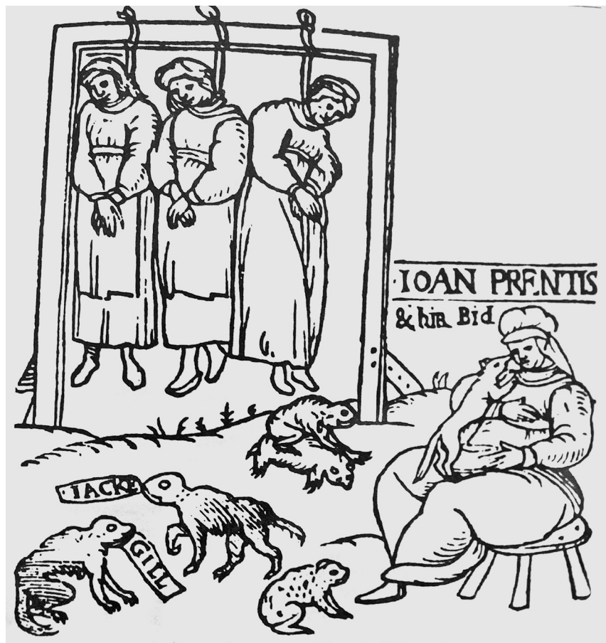
Ил. 11. “Три ведьмы, висящие на виселице”. Гравюра из памфлета: “The Apprehension and confession of three notorious witches”, 1589

памфлетных гравюр мы находим изображение казни нескольких ведьм путем повешения 96 (ил. 11). Подчеркивая легитимный характер “охоты на ведьм”, граверы порой иллюстрировали и процесс суда 97 . (ил. 12) Иногда изображалась и так называемая ордалия (“Божий суд”) в форме испытания водой, обычно практикуемая в качестве судебной процедуры 98 . (ил. 13) В Англии применительно к преступлению ведовства пытки были запрещены и хотя нелегальное их использование зафиксировано в ряде