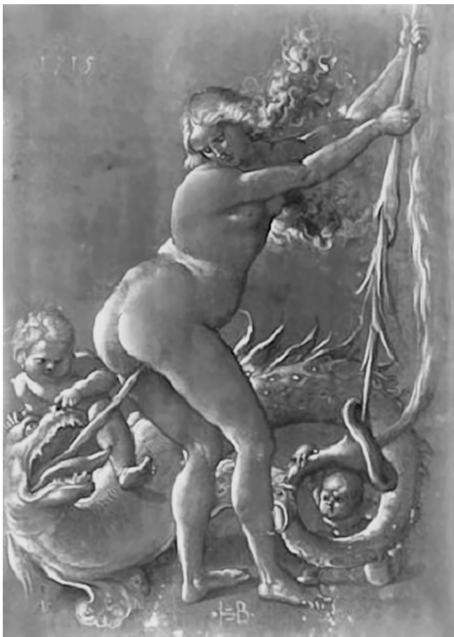
Ил. 5. “Ведьма и дракон”. Гравюра. Hans Baldung Grien. “Witch and Dragon”, 1515

одета. (ил. 7). Можно утверждать, что и в этом случае авторы гравюр, скорее, следуют памфлетному нарративу. Иллюстрации отражают типичное описание ведьмы, удачно сформулированное Реджинальдом Скотом, очевидцем событий знаменитого Сент-Осайтского процесса: “К [...] ведьмам относятся женщины, как правило, старые, хромые, туповатые, бледные, морщинистые, грязные, мрачные, заблуждающиеся в папистской либо вообще не знающие никакой религии... Они – тощие и обезображенные, на их лицах постоянно лежит печать меланхолии, повергающая в ужас всех окружающих. Они – слабоумные, ворчливые, безум-