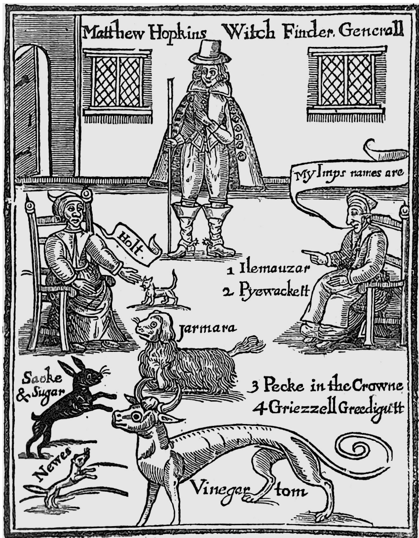
Ил. 12. “Ведьмы рассказывают на суде о своих imps Мэтью Хопкинсу”. Гравюра из памфлета: Н.Ф. “A True and Exact Relation of the severall Informations, Examinations and Confessions of the late Witches, arraigned and executed in the County of Essex”, 1645

Courtesy of the Division of Rare and Manuscript Collections, Cornell University Library