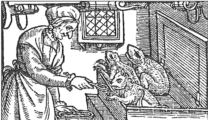
Ил. 1. “Ведьма кормит imps, сидящих в сундуке”. Гравюра из памфлета: “The most strange and admirable discovery of three Witches of Warboys”, 1593

ный наделяла и исполняемые ею роли соответствующим знаком. Так, на гравюре из памфлета 1593 г. она вполне по-матерински кормит с ложки странных зооморфных существ, сидящих в сундуке 20 . (ил. 1) Их облик, выдающий близость к дьяволу, представляет ее “антиматерью”, вскармливающей демонических существ – “антидетей”.