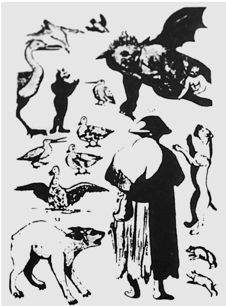
Ил. 4. “Ведьма в окружении imps”. Гравюра из трактата: Gifford G.A. “Dialogue concerning witches and witchcrafts”, 1584

характерным клише так называемого ведовского фольклора, отчасти восходящего к народным верованиям, отчасти – к демонологическим трактатам и судебным протоколам, свидетельствует и то обстоятельство, что описания нападений “домашних духов” и их последствий для людей хотя и различны по степени детали-