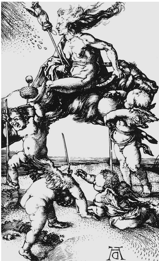
Ил. 6. “Ведьма верхом на козле”. Гравюра. Albrecht Diirer. “Witch Riding Backwards on a Goat”, 1500

ные, дьявольские и не сильно отличаются от тех, кто считается одержимым духами” 55 .