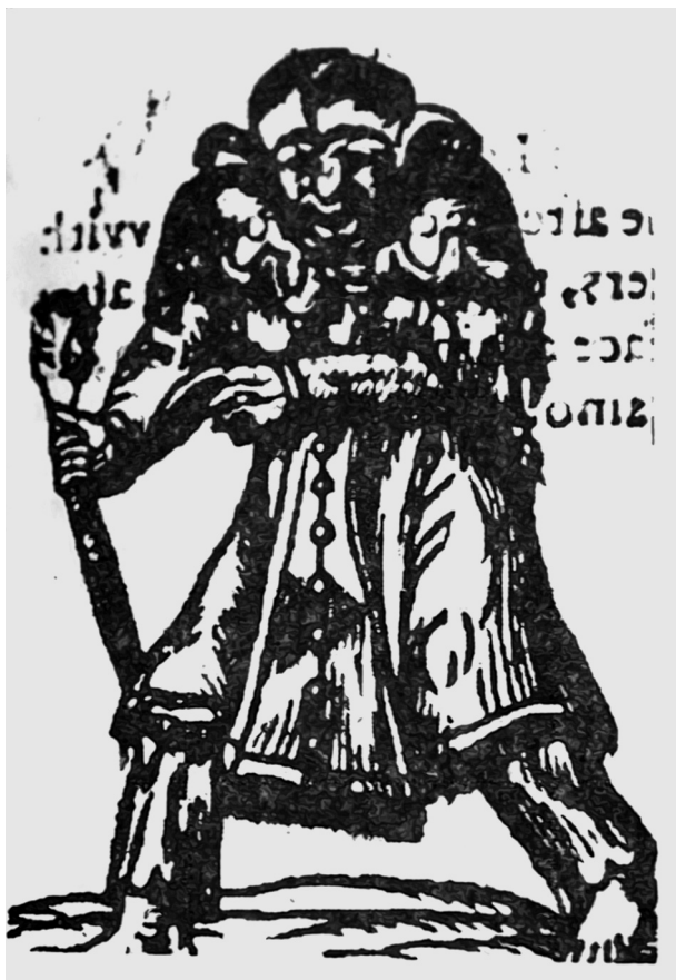
Ил. 7. “Ведьма с клюкой”. Гравюра из памфлета: G.B. “A Most wicked work of wretched witch”, 1592

ной ведьмы” – писал один из памфлетистов 56 . Реджинальд Скот расширил эту неприглядную характеристику: “Эта бедная старая ведьма в целом необразованна, неподготовлена и не обеспечена советом и дружбой, лишена справедливости и свободы выбора смягчать свою жизнь и общение, ее род и пол более слабый и непостоянный, чем мужской, и намного больше склонен к меланхолии... ее возраст обычно таков, что делает ее немощной, а немощность приводит к болезни, при которой рот ее говорит глупости...” 57 . Старость, уродство и ущербность, которые при-